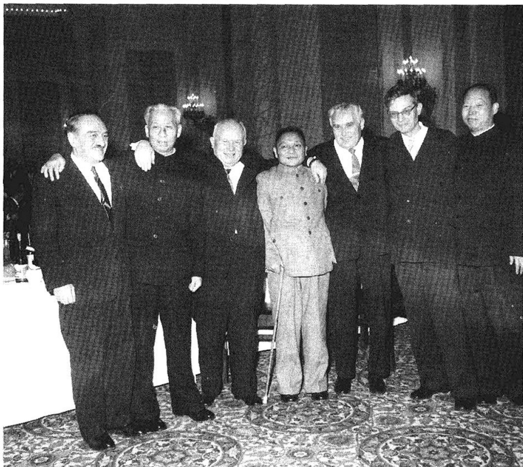
米高扬、刘少奇、赫鲁晓夫、邓小平、科兹洛夫、苏斯洛夫、彭真（左起）在1960年12月2日苏联共产党中央委员会主席团举行的招待各国共产党和工人党代表会议参加者的宴会上。孟庆彪摄（新华社稿）

墓地。周恩来在向大会致辞时对一个党在自己的代表大会上公开片面地指责兄弟党的行为明确表示反对。 ① 为抗议苏共再次掀起反斯大林高潮，中共代表团退出会场并到斯大林墓前敬献花圈。周恩来还以提前回国的方式彰显中共的立场。从1961年11月开始，赫鲁晓夫不断发表讲话，苏联报刊也连篇累牍地发表文章，攻击阿尔巴尼亚和中国。在1962年11月至1963年1月期间的保加利亚、匈牙