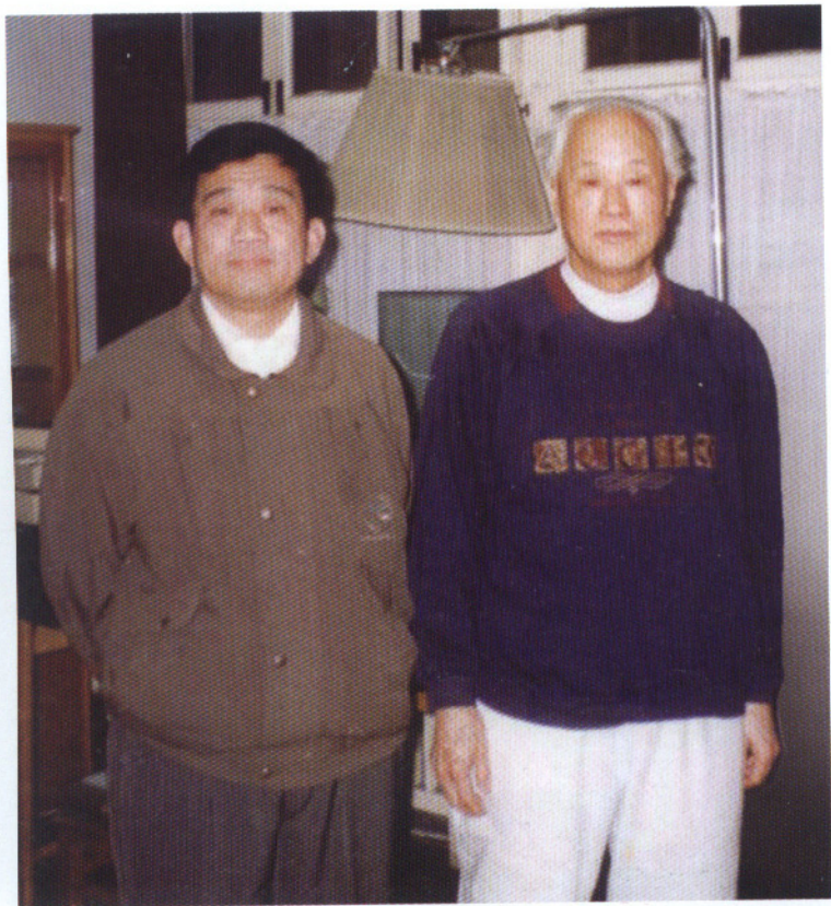
趙紫陽接受訪問後，在家中與本書作者合影。