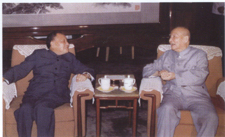
鄧小平與陳雲這兩位超級革命元老，主導了整個20世紀80年代和90年代初中國的政治與經濟路向。