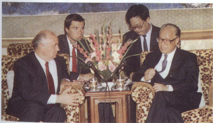
趙紫陽向蘇共總書記戈爾巴喬夫透露中國「重要問題仍然要鄧小平掌舵」，成為他被罷黜的罪名之一。