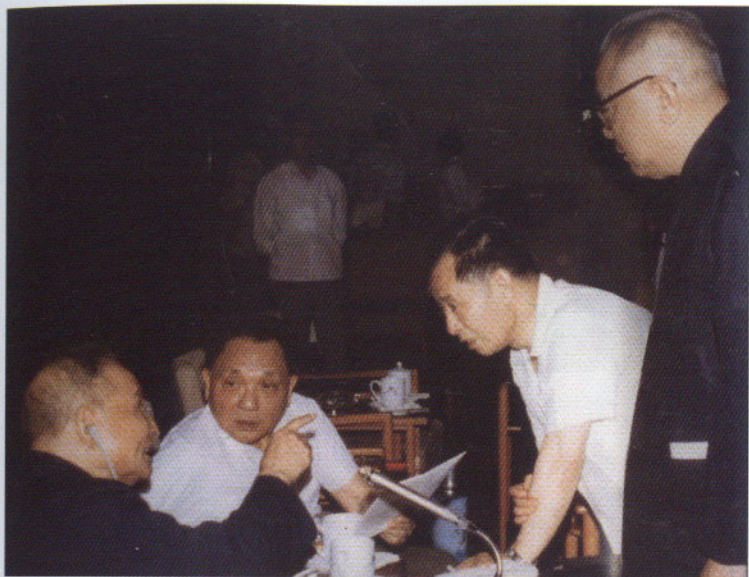
胡耀邦（右二）雖然身為中共總書記，但仍要對陳雲（左一）、鄧小平（左二）和李先念（右一）這幾位超級元老畢恭畢敬。