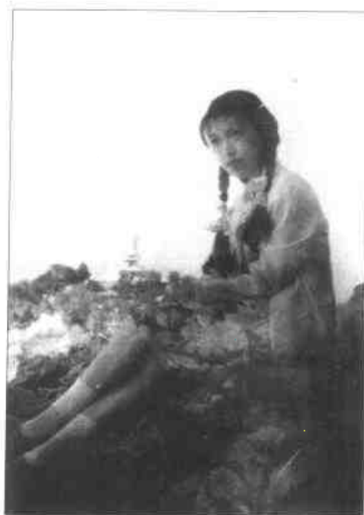
1959年的林昭，摄于北京北 海公园