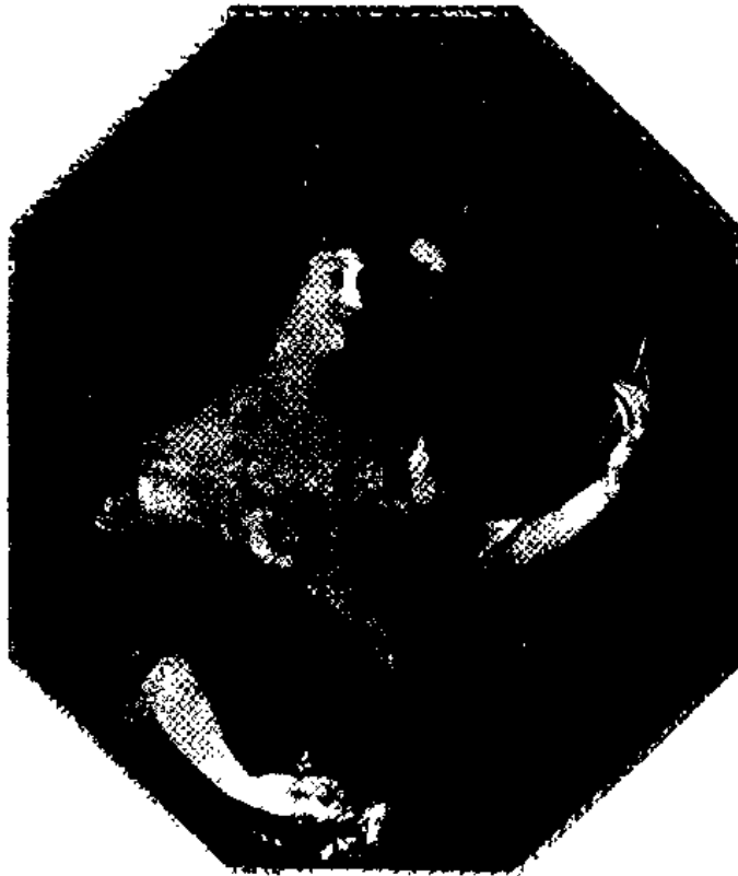
图6 米纳·蒙特斯班夫人 选自Pierre Pradel 著《路易十四时期的艺术》