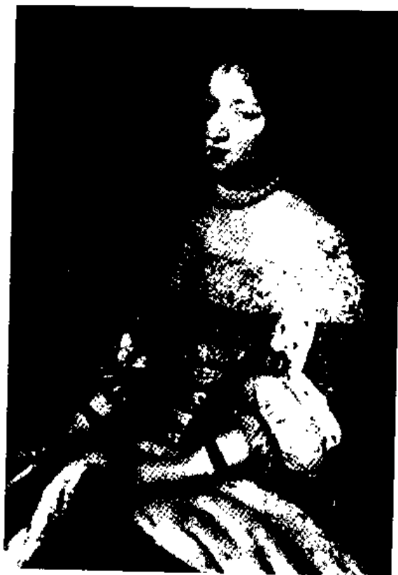
图2 Jean Nocret 奥地利的安· 凡尔赛宫