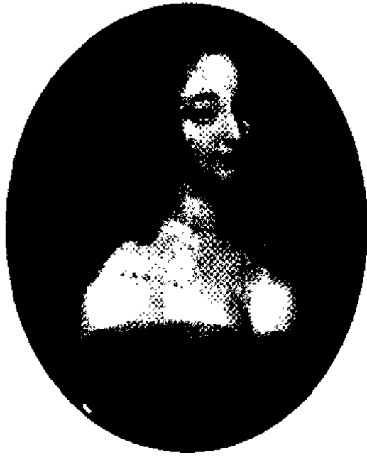
图5 姓名不详之艺术家：妮农 凡尔赛宫