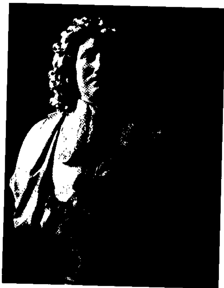
图3 科西伏特: 柯尔伯。 凡尔赛宫