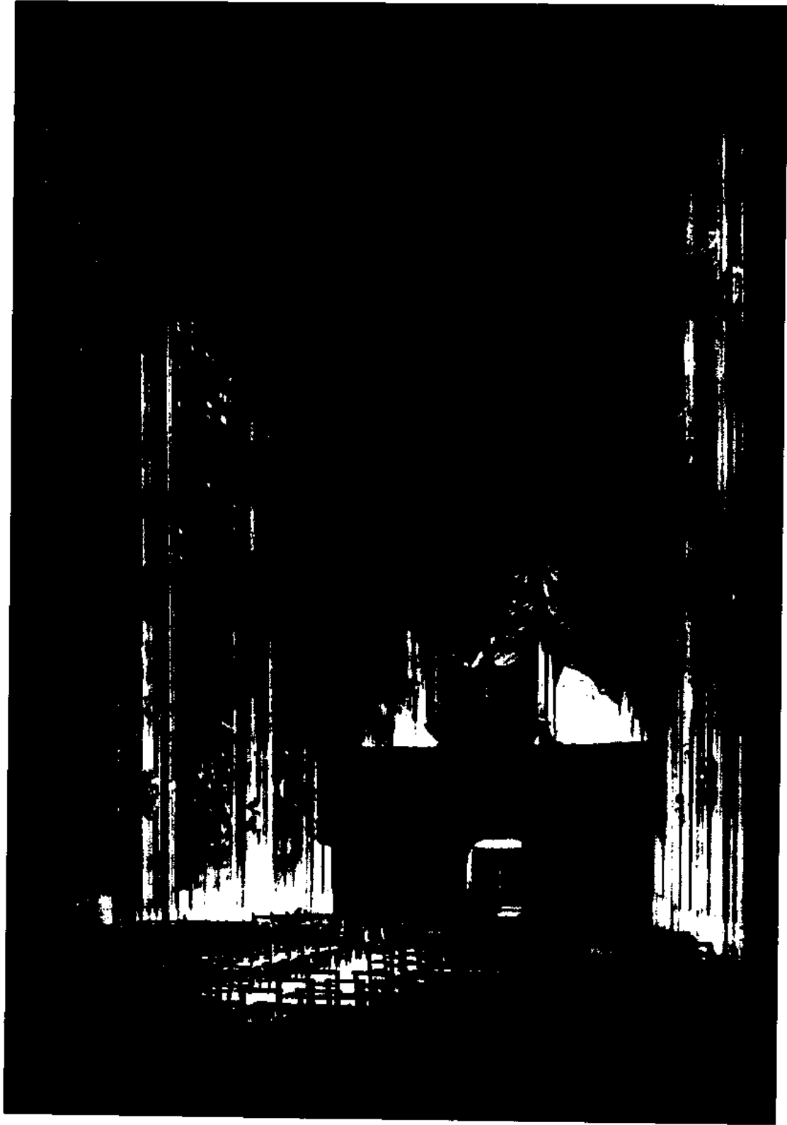
图5 国王学院礼拜堂(内部)。剑桥