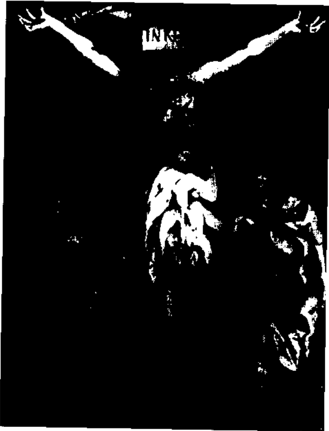
图9 格吕奈瓦德: 耶稣被钉十字架。 节自“Isenheim 祭坛”之绘画。科耳 马博物馆