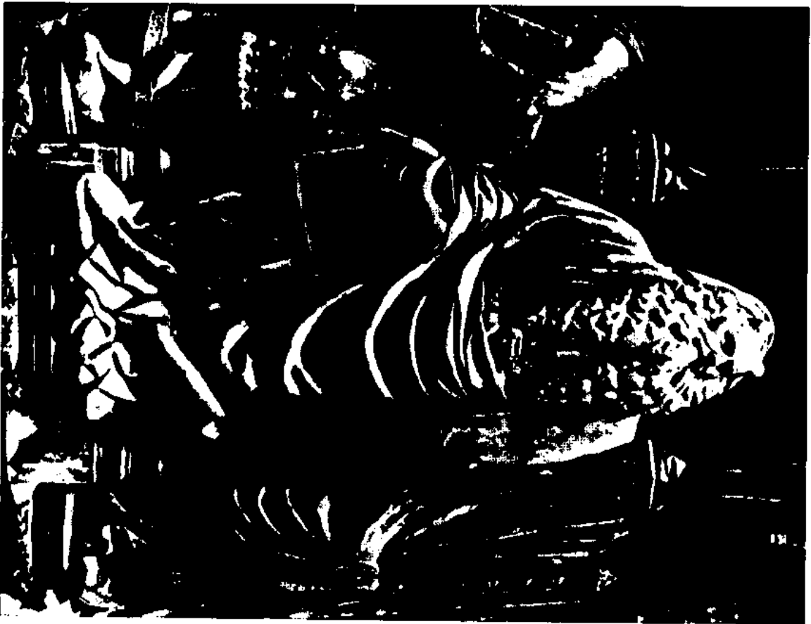
图2 Claus Sluter: 摩西, 第戎博物馆