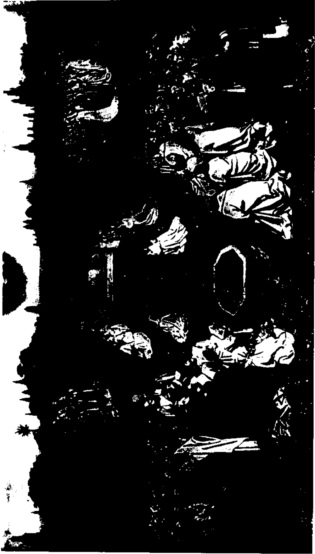
图4 艾克朗伯特与艾克扬合绘：敬拜羔羊。根据 St. Bavon 教堂