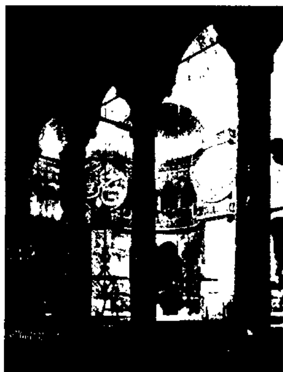
图2 君士坦丁堡 Hagia Sophia 的内部