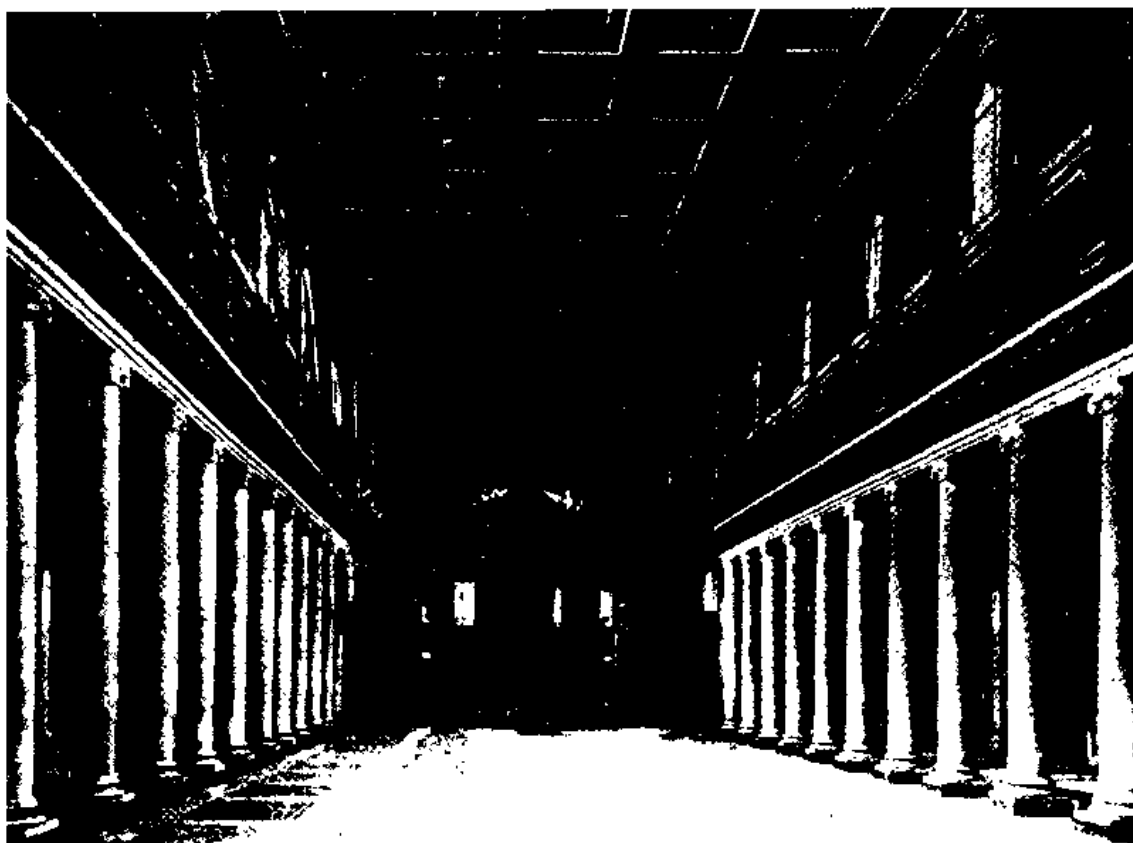
图1 罗马 Santa Maria Maggiore 的内部