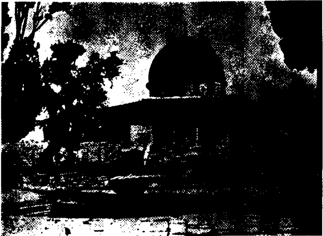
图6 耶路撒冷岩石圆顶