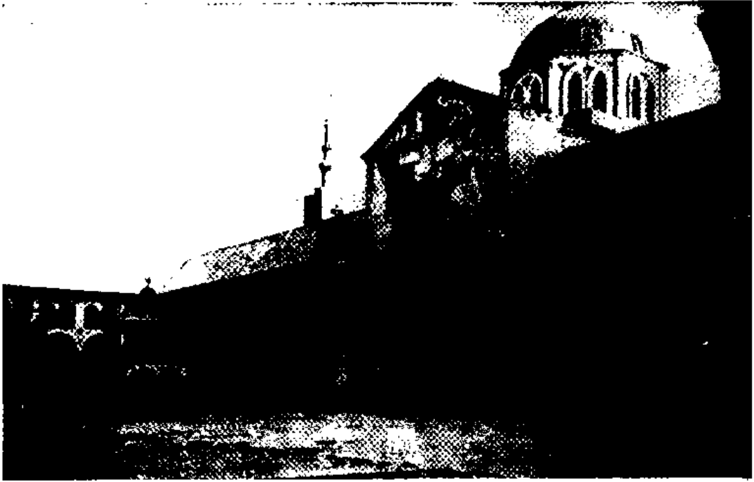
图5 大马上革大寺院之宫庭