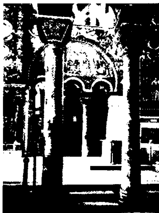
图3 意大利拉温那 San Vitale 的内部