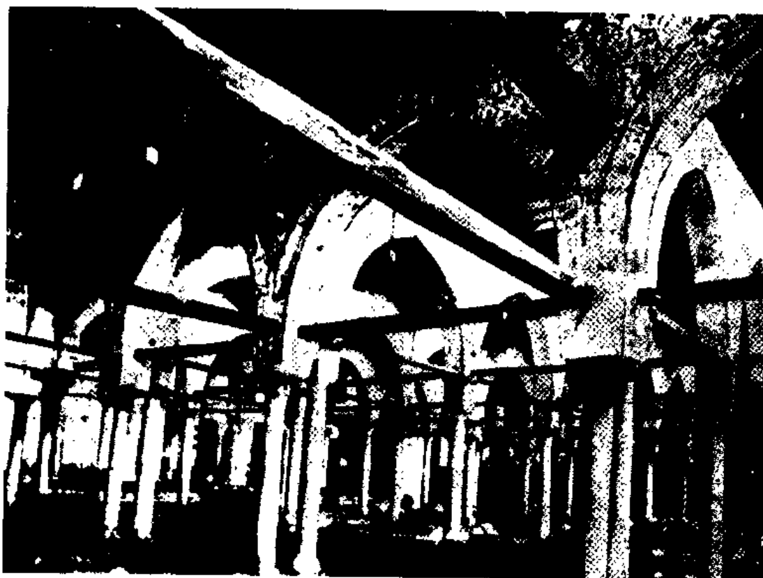
图8 开罗 El Azhar 寺院之庭院